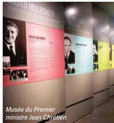
Musée du Premier ministre Jean Chrétien

D'ailleurs, juste en face de l'hôtel où se tient le congrès, vous pouvez apercevoir la Cité de l'Énergie.