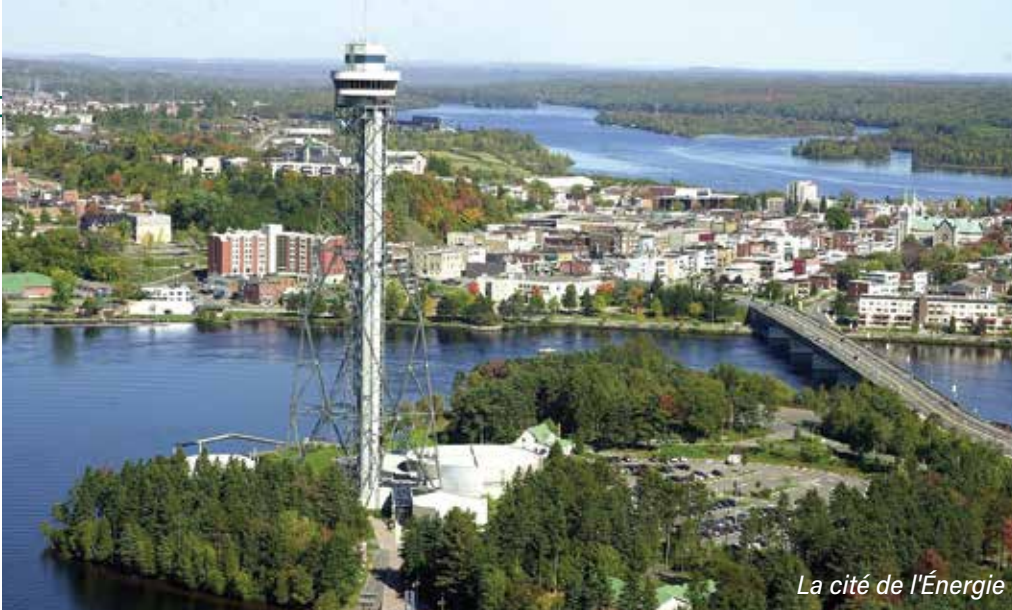
La cité de l'Énergie