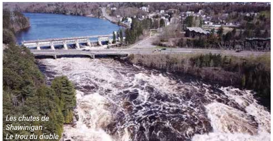
Les chutes de Shawinigan - Le trou du diable

Ce congrès sera l'occasion idéale de nous réunir, de célébrer nos réalisations et de nous unir pour un avenir encore plus rayonnant pour l'Afeas.