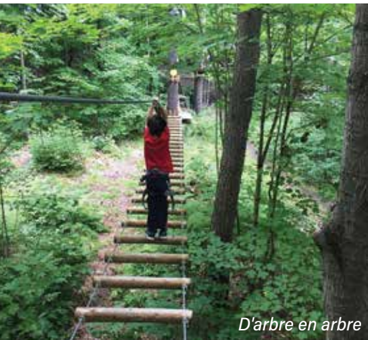
D'arbre en arbre

Shawinigan, ville au confluent de la rivière Saint-Maurice et de la rivière Shawinigan, est fière de se présenter comme la ville hôte du prochain congrès provincial de l'Afeas, qui se tiendra les 23, 24 et 25 août prochains.